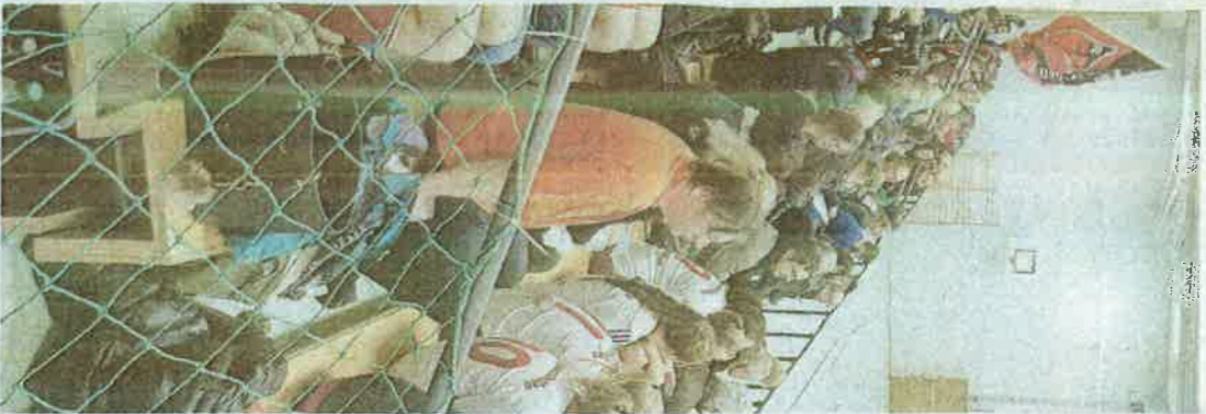
Bock auf Frauen-Futsal? Das hatten die Gäste auf der Tribüne.

Immer hochprofessionell: Der Club mit Klemmbrett auf der Tribüne.