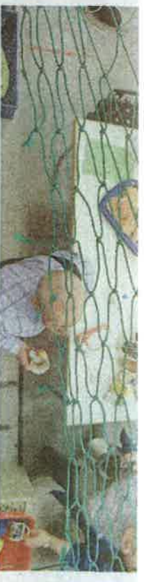
Schutz vor herantfliegenden Bällen und Löcher, um Käsestangen auf die Tribüne durchzureichen: Der FCP und sein Netz.