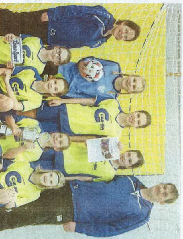
Das Turnier der U13-Juniorinnen begann zum Argernis der Teams und Zwickauerinnen mit einem 2:0 gegen den FC Pegnitz.