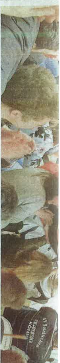
Gute Laune unter der Fahne: Wie sehr man sich über einen siebten Platz freuen kann, zeigten die Anhänger der SG Forchheim/Sulzkirchen.