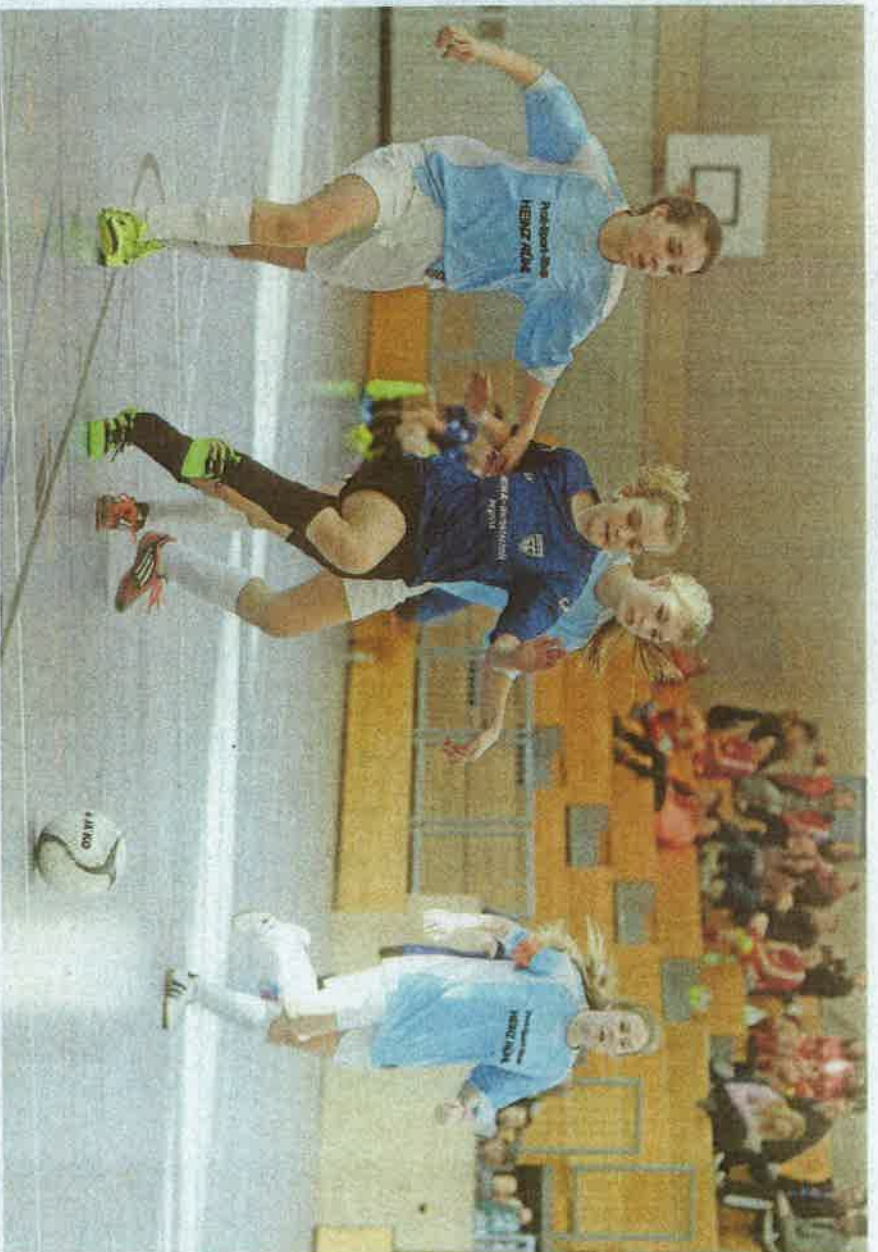
Hallenkreismeisterschaft im Frauenfußball in Adelsdorf in der U17: Der FC Dechsendorf in hellblauen Trikots spielte gegen FC Pegnitz in dunkelblauen Trikots. Eine ähnliche Partie wird am Wochenende lauten.

Der Bezirksoberligist aus dem Landkreis Neumarkt schlug im Finale der diesjährigen Kreismeisterschaft im Kreis Neumarkt/Jura den Klassenhöheren SV Leerstetten und verdiente